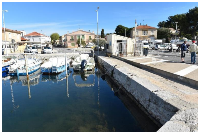
Illustration et implantation de l'ouvrage

Site : BOUZIGUES Adresse : Port de Bouzigues