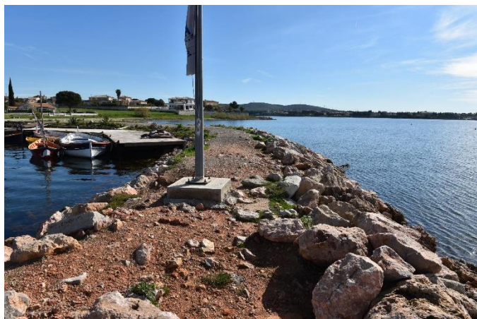
Illustration et implantation de l'ouvrage

Site : BOUZIGUES Adresse : Port de Bouzigues