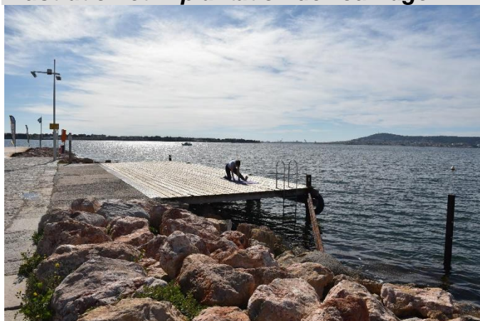
Illustration et implantation de l'ouvrage

Site : BOUZIGUES Adresse : Port de Bouzigues