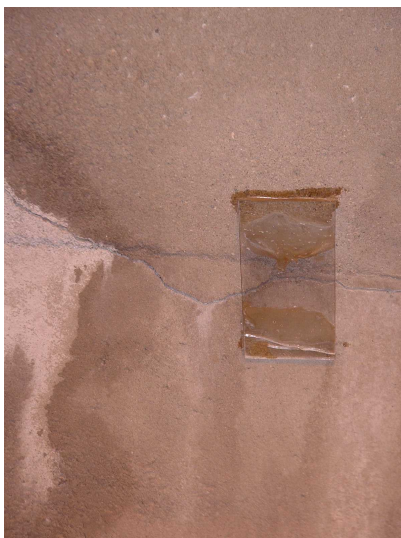
C -- 03/06/2019 16:28:14