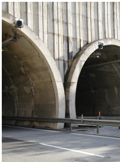
B -- 03/06/2019 16:21:29