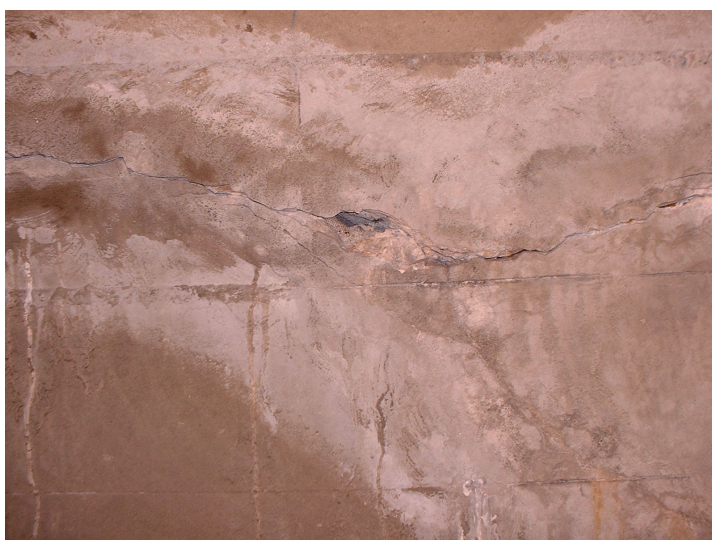
L -- 03/06/2019 16:17:17