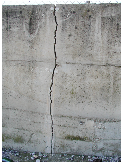
K -- 03/06/2019 16:14:00