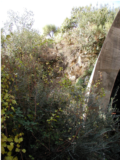
A -- 03/06/2019 16:19:49