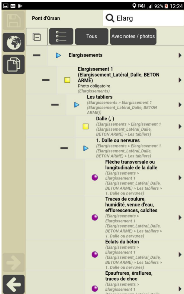
Pont d'Orsan : Elargissement latéral Dalle