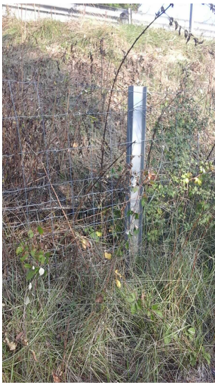
E -- 22/10/2018 11:38:50 -- 43,544719 / 6,811117