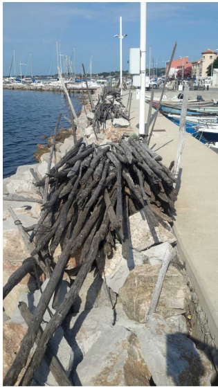
B -- 12/07/2018 10:14:50