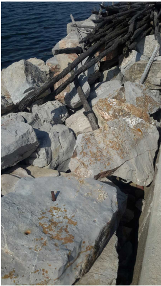
C -- 12/07/2018 10:16:05