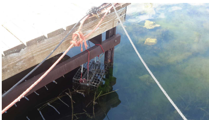
B -- 12/07/2018 09:57:44

Ras prévoir une visite de sous face de quai