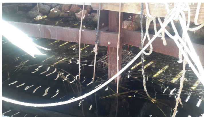
D -- 12/07/2018 09:58:59