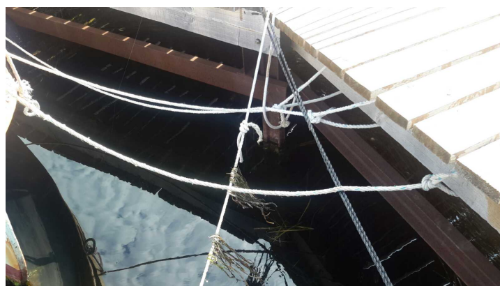
C -- 12/07/2018 09:58:11