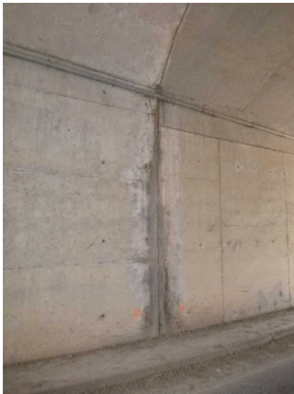
E -- 30/04/2020 16:32:05