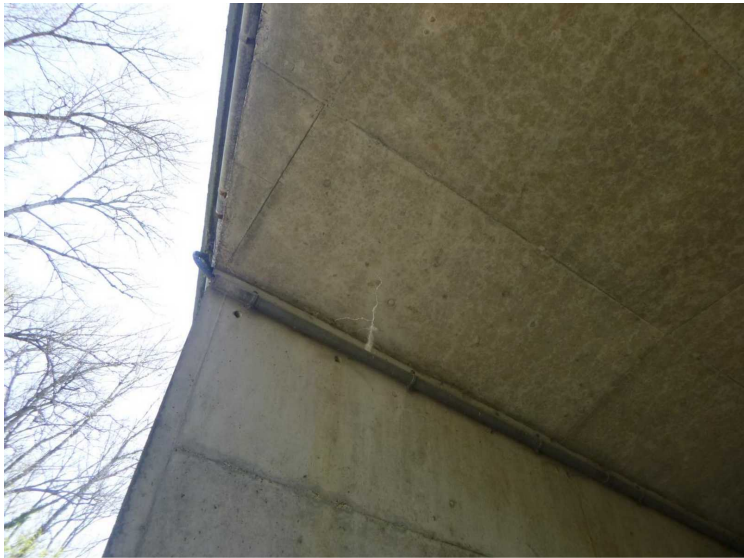
G -- 30/04/2020 16:32:29