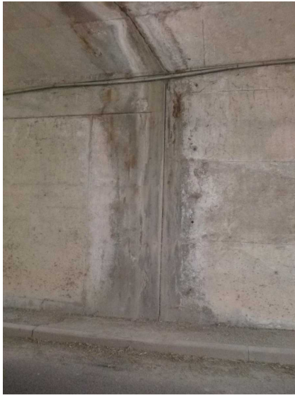
D -- 30/04/2020 16:32:01