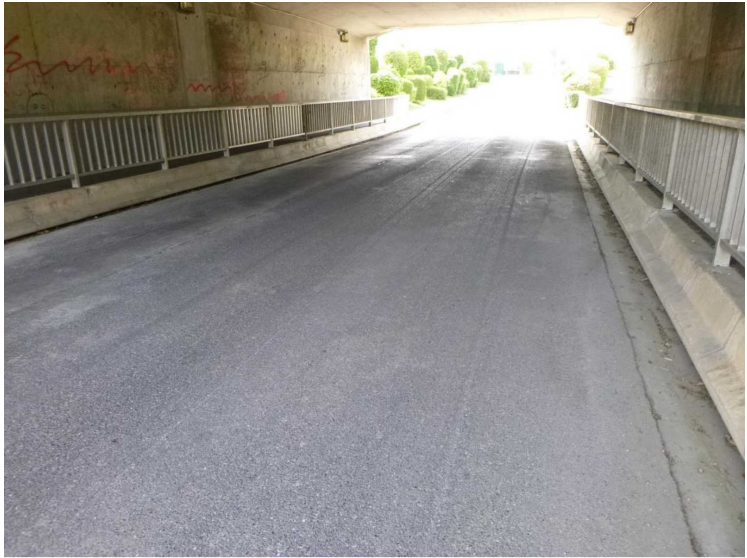
B -- 30/04/2020 16:22:44