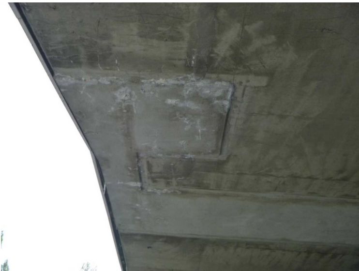
E -- 30/04/2020 16:23:11