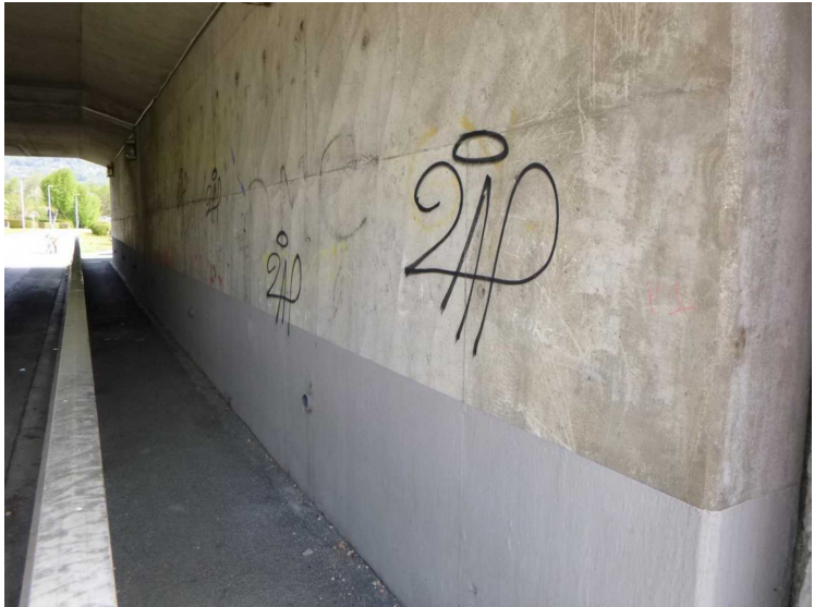
C -- 30/04/2020 16:22:56