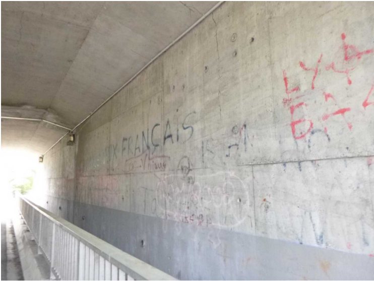
D -- 30/04/2020 16:23:02