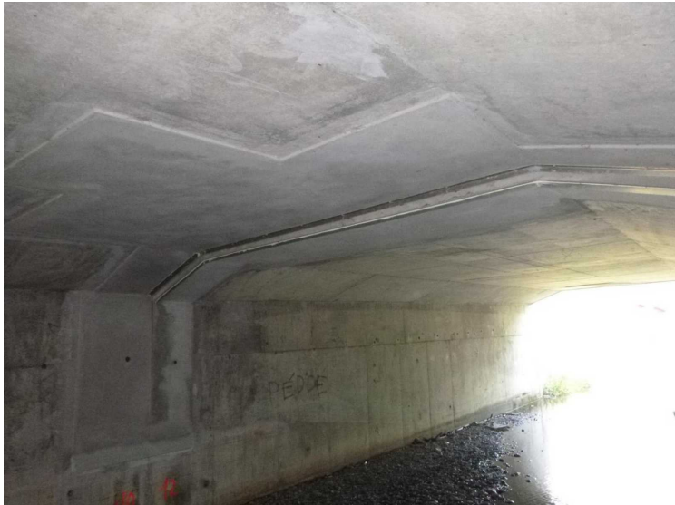
E -- 30/04/2020 17:10:42