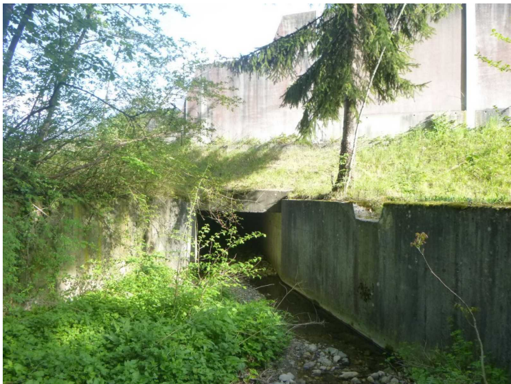
A -- 30/04/2020 17:19:49