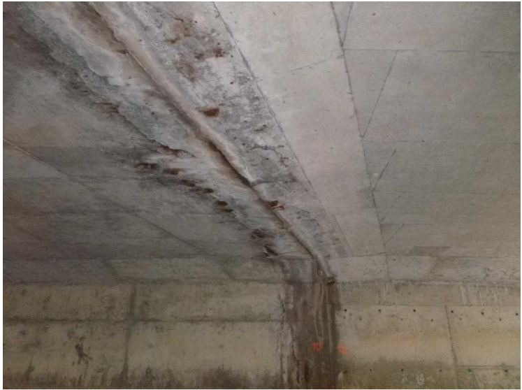
E -- 30/04/2020 17:14:44