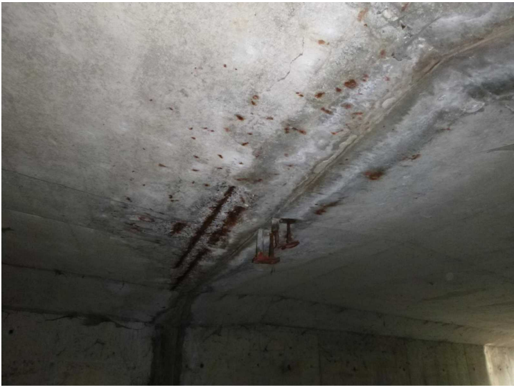
D -- 30/04/2020 16:21:21