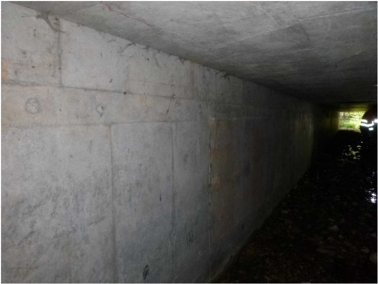
D -- 30/04/2020 17:20:58