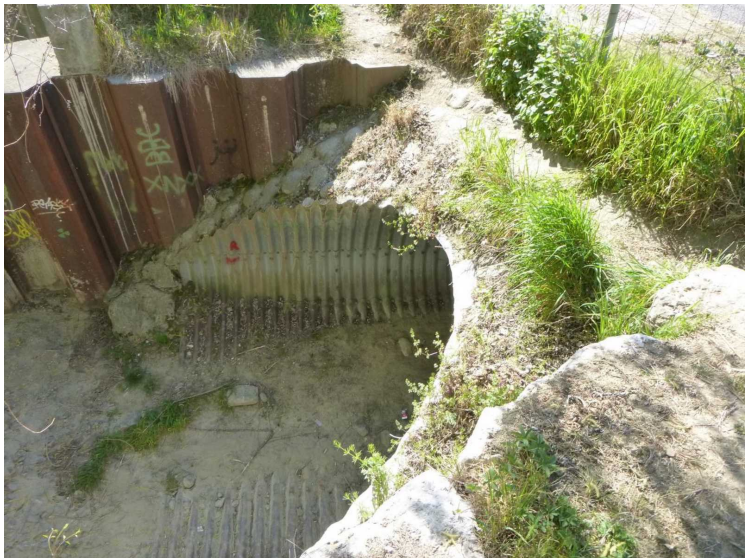
C -- 30/04/2020 15:50:40