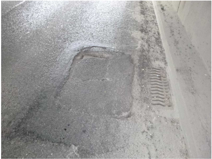
C -- 30/04/2020 16:25:04