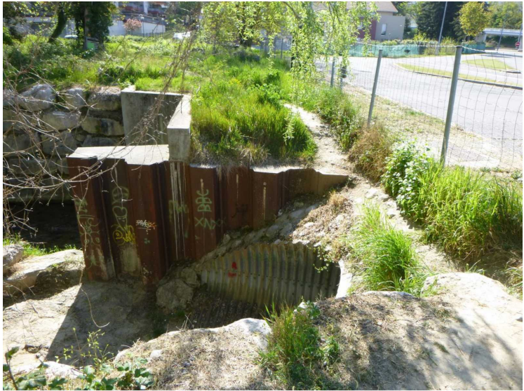
B -- 30/04/2020 15:50:34