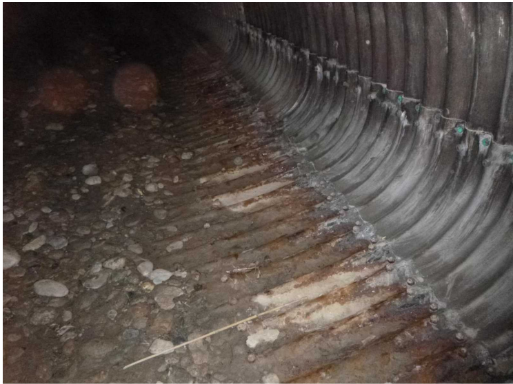
D -- 30/04/2020 15:50:51