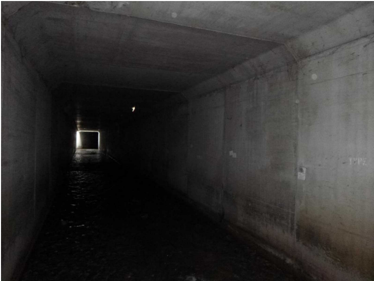
C -- 30/04/2020 17:18:22