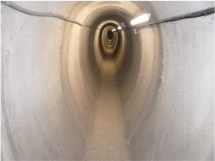
C -- 30/04/2020 17:26:34