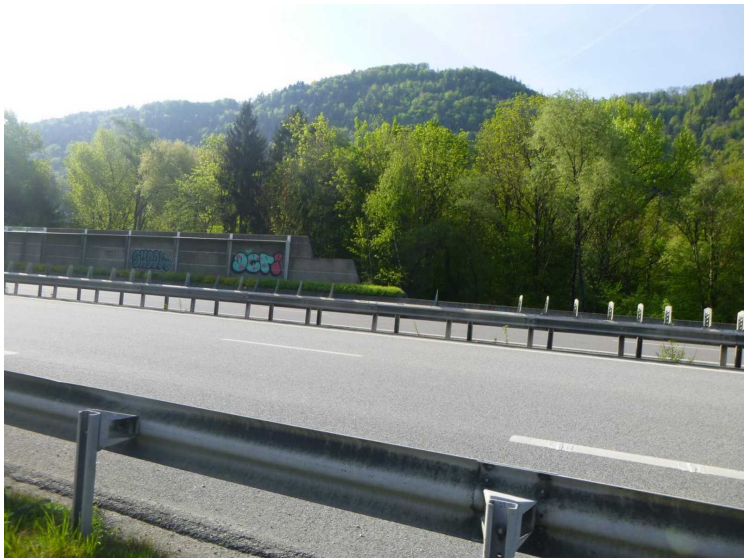
B -- 30/04/2020 17:20:17