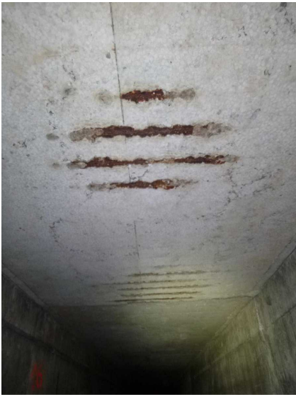
F -- 30/04/2020 17:25:13