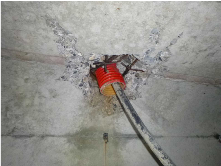
D -- 30/04/2020 17:30:44