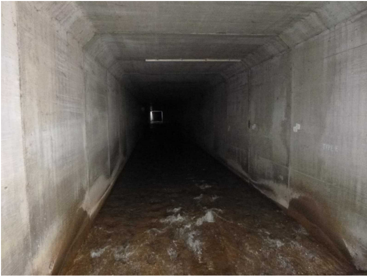
B -- 30/04/2020 17:18:13