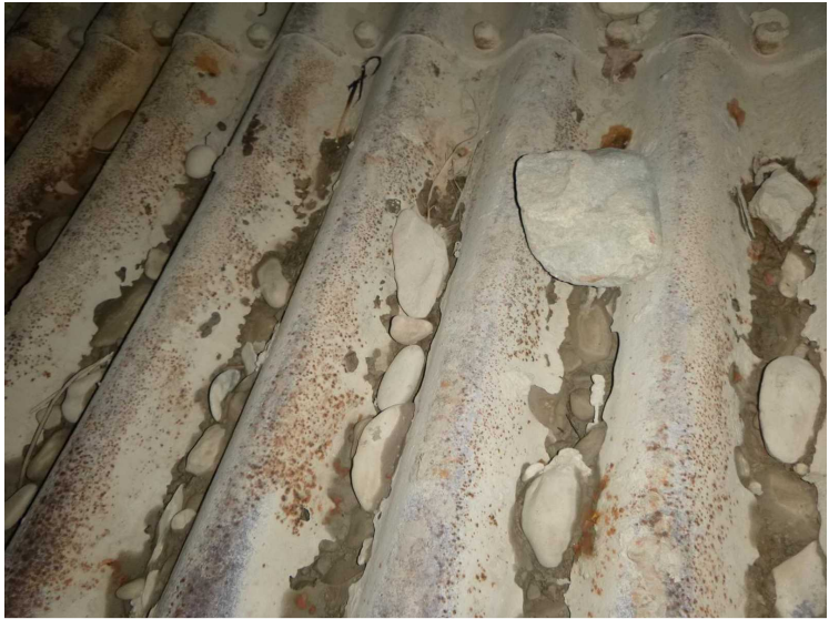
F -- 30/04/2020 15:51:16