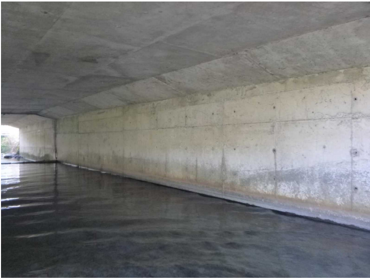
B -- 30/04/2020 17:14:21