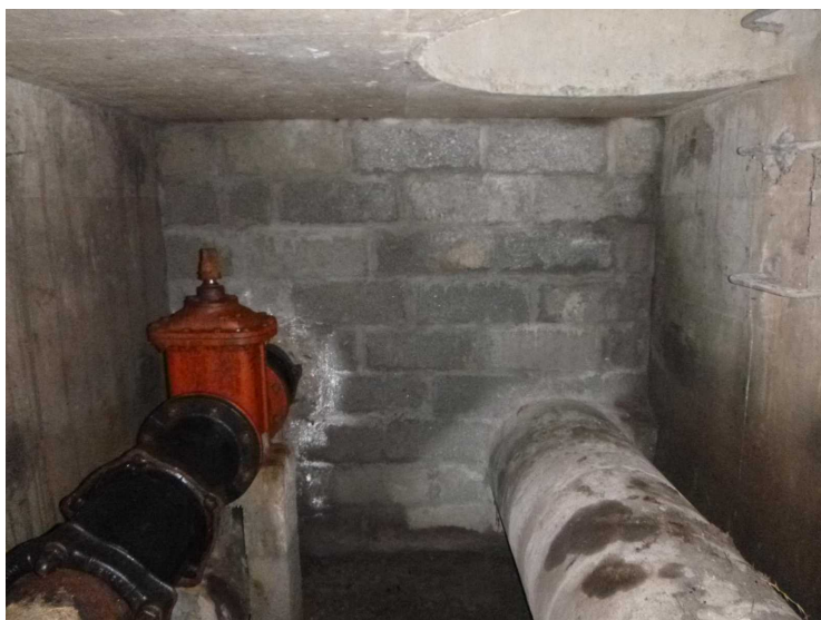
D -- 30/04/2020 17:24:41

Appuis Pas d'évolution depuis la précédente visite. nom du champ :