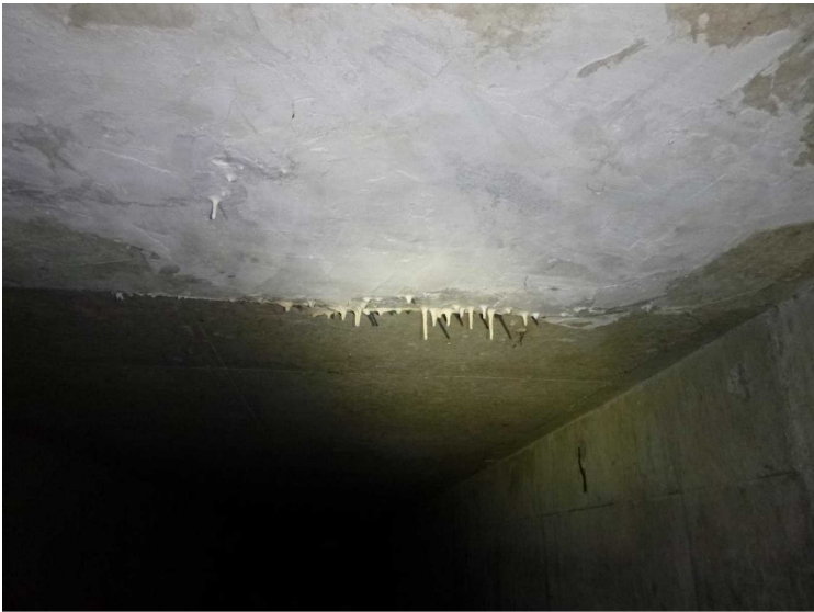
E -- 30/04/2020 17:25:07