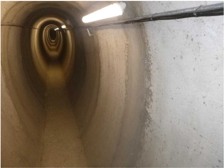
B -- 30/04/2020 17:26:29