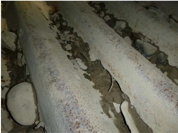
E -- 30/04/2020 15:50:56