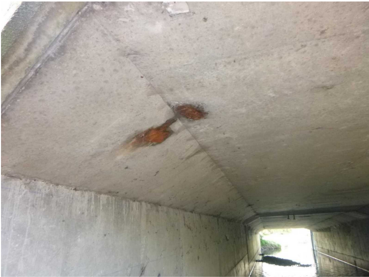
E -- 30/04/2020 16:21:25