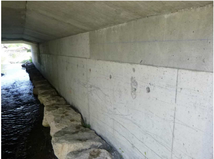
C -- 30/04/2020 17:10:26