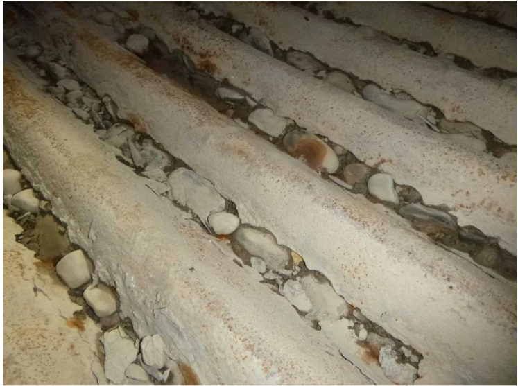
G -- 30/04/2020 15:51:21