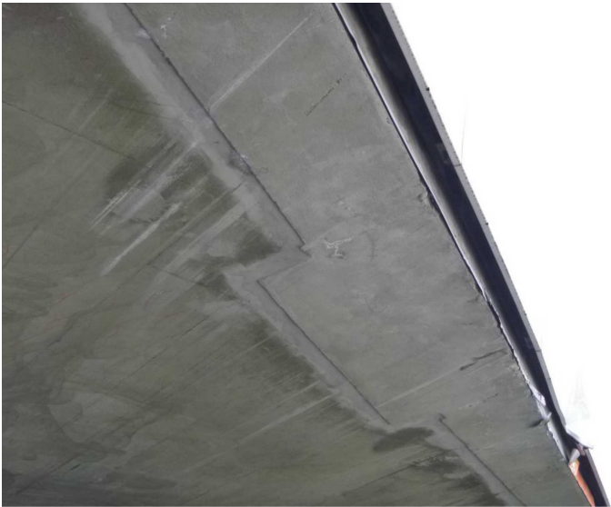
F -- 30/04/2020 16:26:23