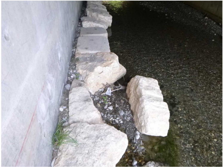
B -- 30/04/2020 17:09:38