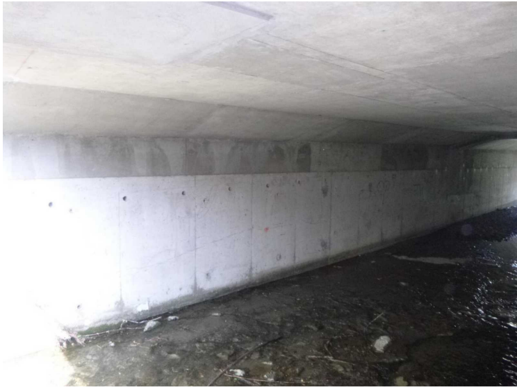
D -- 30/04/2020 17:10:32