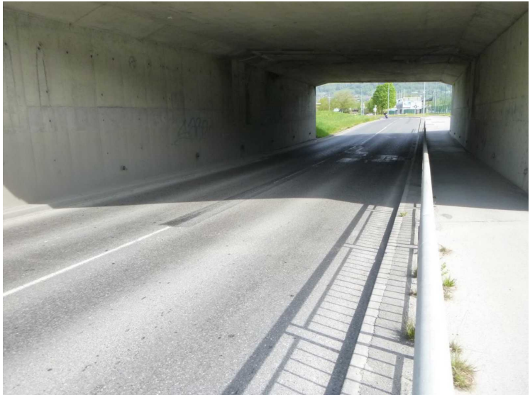
B -- 30/04/2020 16:24:57