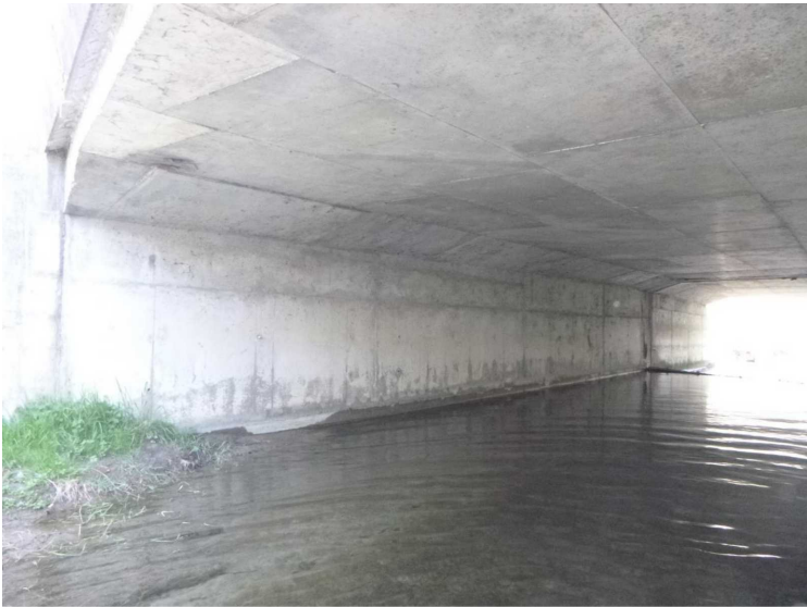
C -- 30/04/2020 17:14:27