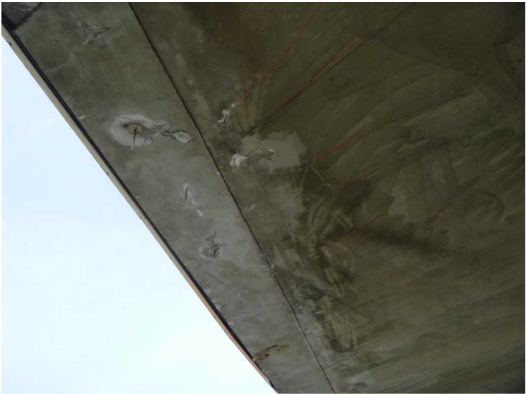
E -- 30/04/2020 16:26:18