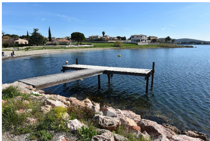
Illustration et implantation de l'ouvrage

Site : BOUZIGUES Adresse : Port de Bouzigues