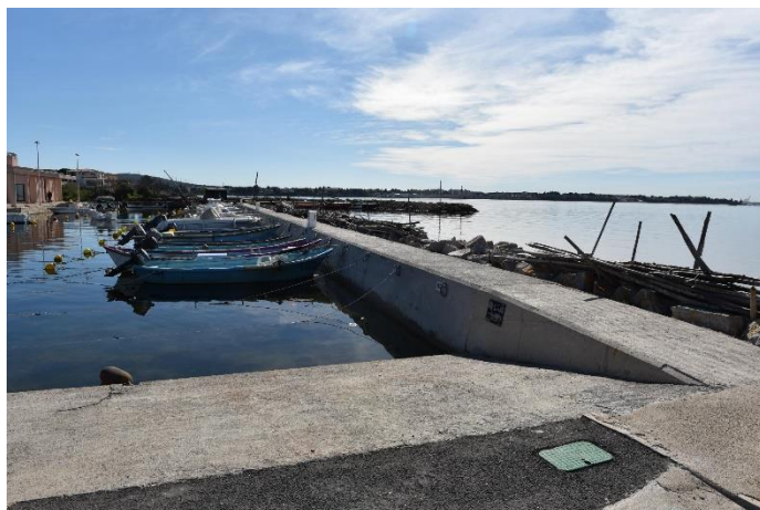
Illustration et implantation de l'ouvrage

Site : BOUZIGUES Adresse : Port de Bouzigues