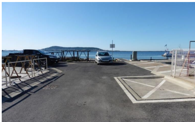
Illustration et implantation de l'ouvrage

Site : BOUZIGUES Adresse : Port de Bouzigues