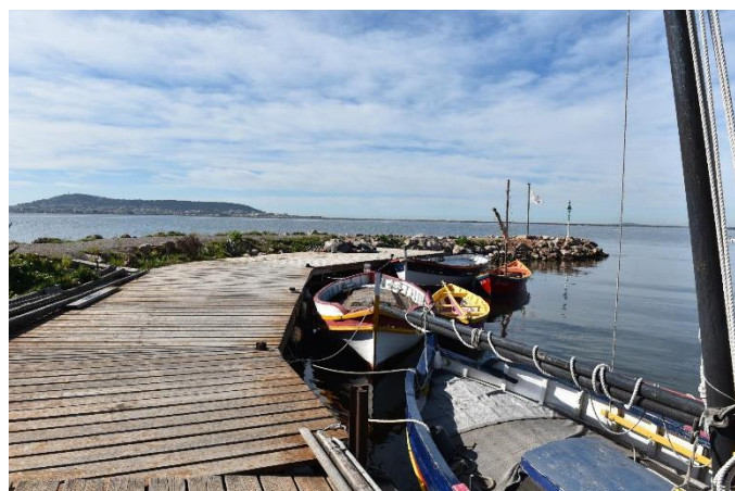
Illustration et implantation de l'ouvrage

Site : BOUZIGUES Adresse : Port de Bouzigues