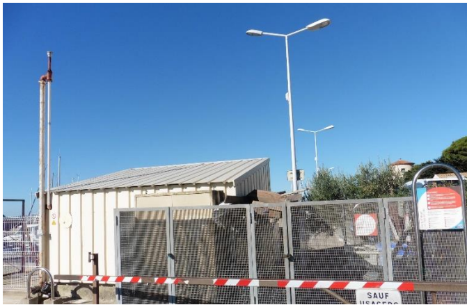
Illustration et implantation de l'ouvrage