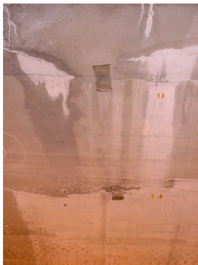
G -- 21/05/2019 16:34:38